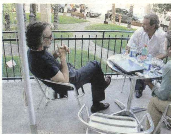
Al tavolino con un mito Franz Di Cioccio, mitico cantante e leader della Premiata Forneria Marconi, ha scelto Provvidenti per fare musica, preparare dischi e tournée